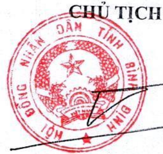
Hồ Quốc Dũng