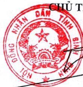
Hồ Quốc Dũng