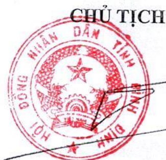
Hồ Quốc Dũng